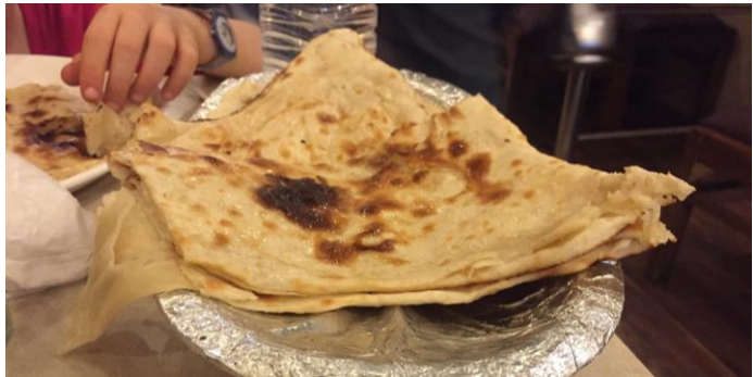
Naan aux fromages pour le déjeuner et diner