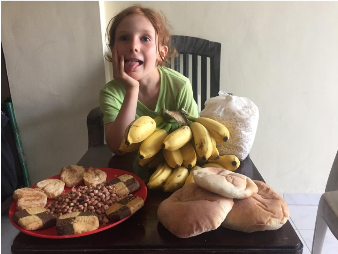
Un diner de fruits, riz soufflé, biscuits, bananes et pain indien !