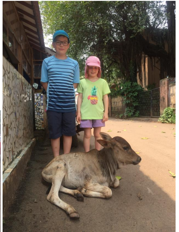
Vaches sacrées au milieu des rues