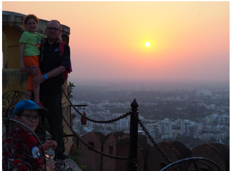
Village des éléphants et couché de soleil sur Jaipur