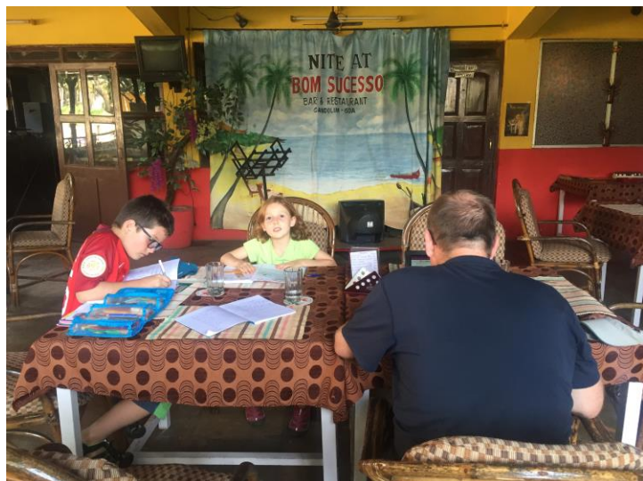
L'école un peu tous les jours et un peu partout !