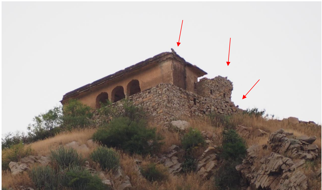
Rencontre avec 3 léopards en position de chasse au dessus du palais des singes