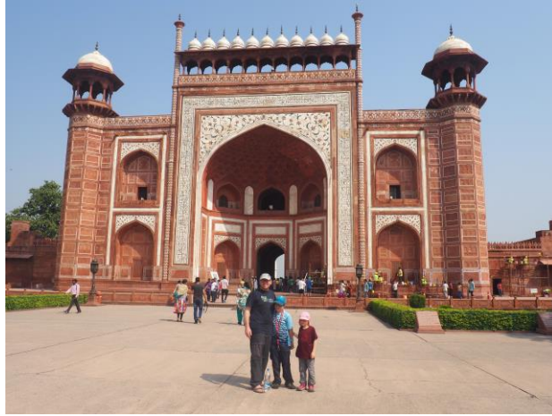
L'entrée du Taj Mahal