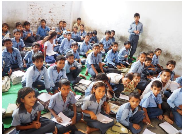
Rencontre avec une école de campagne entre Jaipur et Agra