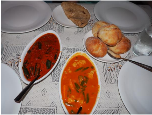
Déjeuner avec Chapati, Bhindi Masala, Goan Veg. Curry, pain