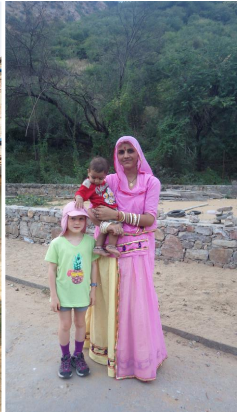
Village des éléphants et rencontre dans le palais des singes